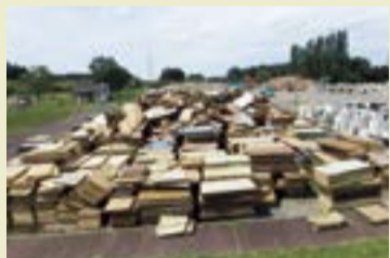
令和4年8月水害で設置された 村上市の災害廃棄物仮置場

近年、日本各地でさまざまな災害が発生しています。大規模災害が起き、多量の廃棄物が発生した場合、次のとおりお願いします。