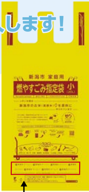
新しい袋のデザイン(イメージ)