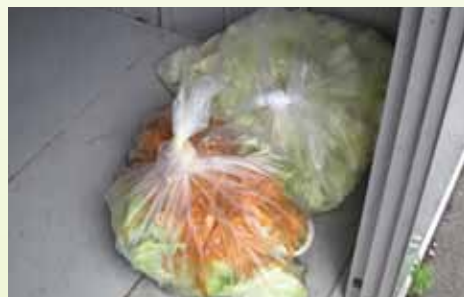
学校給食の調理残さ