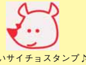
かわいいサイチョースタンプ♪