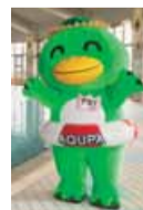
マスコットキャラクター アクパくん