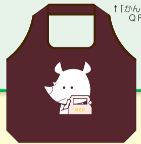
サイチヨエコバッグ (イメージ)