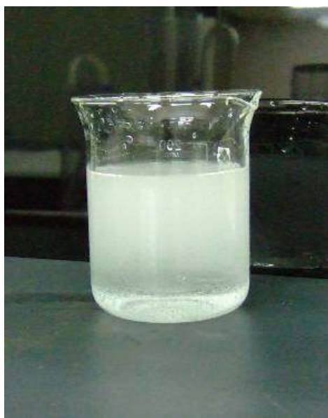
目に見えない無数の気泡により白く濁ったように見えます。

気泡が原因で、じゃ口からの水が左下のように白く濁っていた場合、時間が経つにつれて右側の写真のように気泡が消えて透明になっていきます。