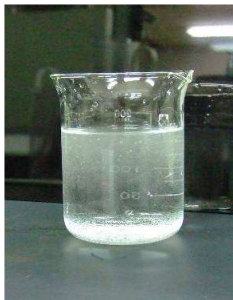
徐々に気泡がなくなり透明になっていきます。