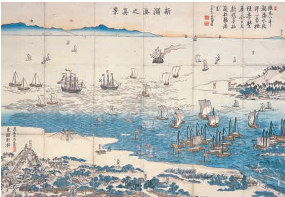
外国調査船の来航と警護の諸藩を描いた「新潟湊之真景」

明治時代の幕開けとともに、世界に開かれた 港としてスタートを切った新潟。そこに近代水道 がうぶ声をあげるまでには、さらに40年以上の 歳月を要することになります。