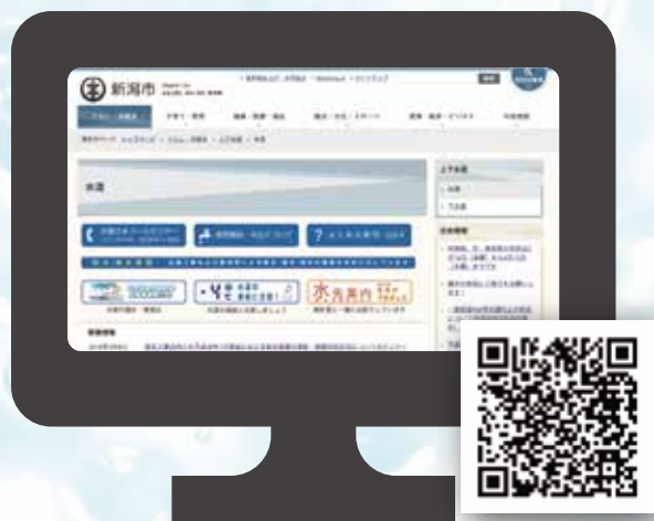
水道局ホームページ