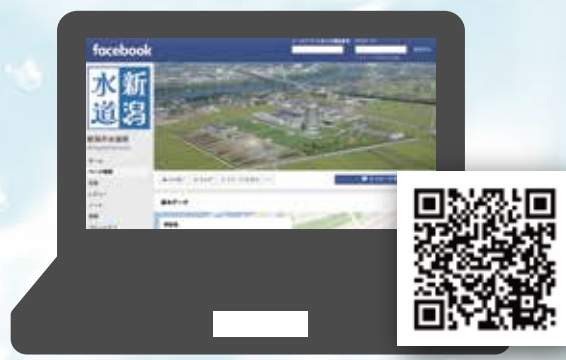
水道局フェイスブック