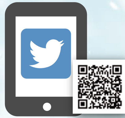
危機管理防災局ツイッター