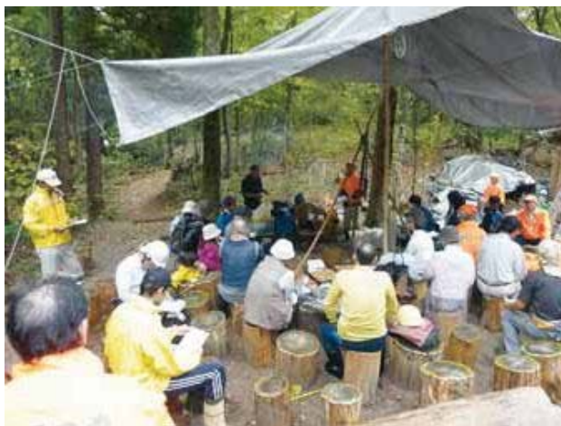
森づくり体験教室