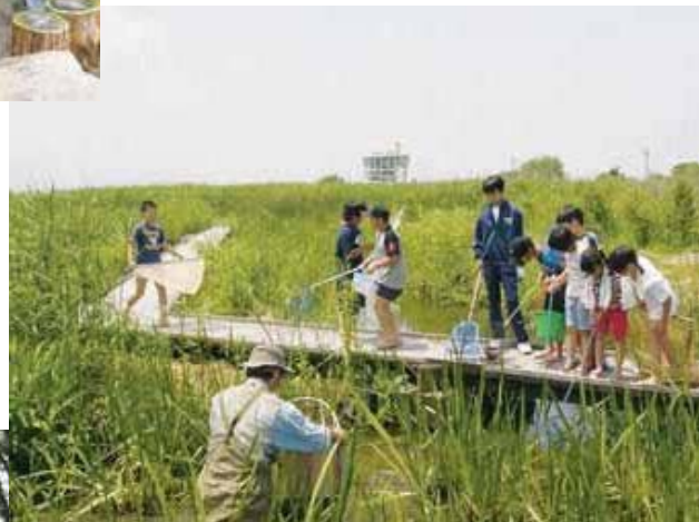
福島潟での動植物観察会