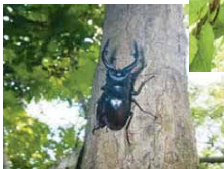
ノコギリクワガタ