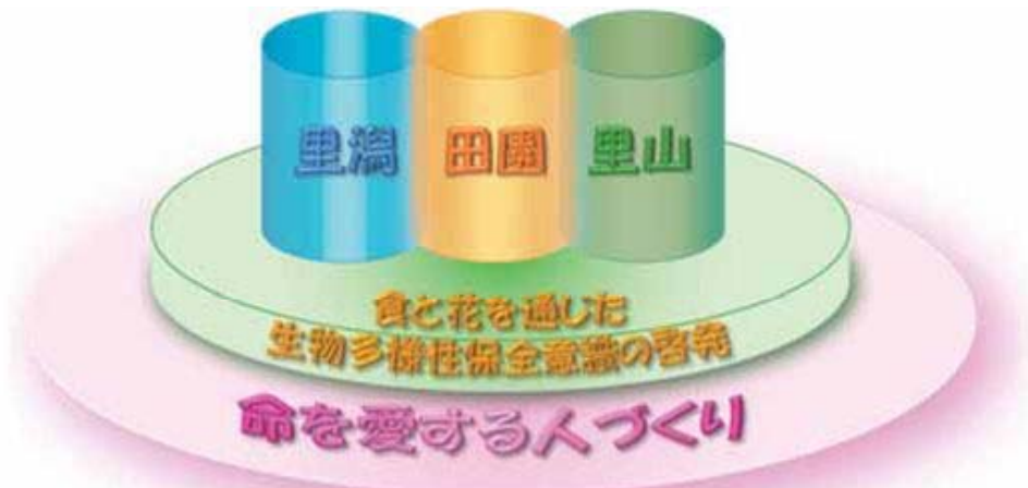
【にいがた命のつながりプロジェクトの構成】