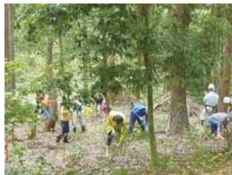
森づくり体験教室