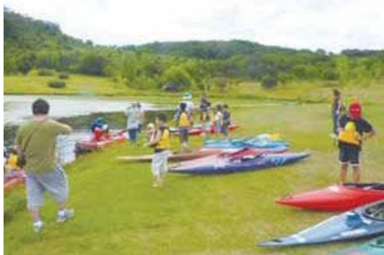
アキハアウトドアスポーツフェスタ (カヌー体験教室)