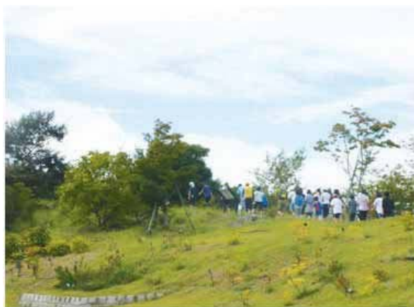
初心者トレイルランニング教室