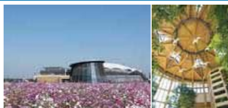
新潟市食育・花育センター