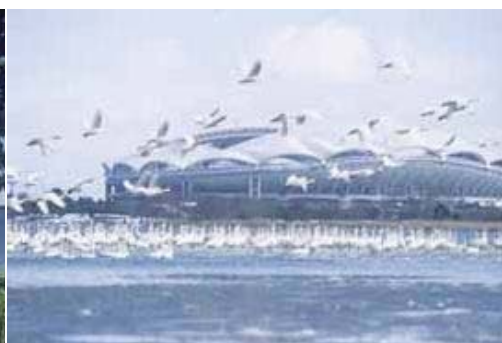
鳥屋野潟に飛来する水鳥