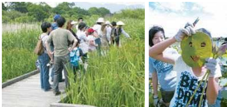
自然観察会に参加する市民