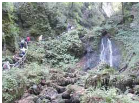
にいつ丘陵トレッキング