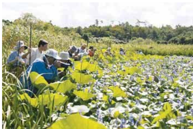
ミズアオイ観察会