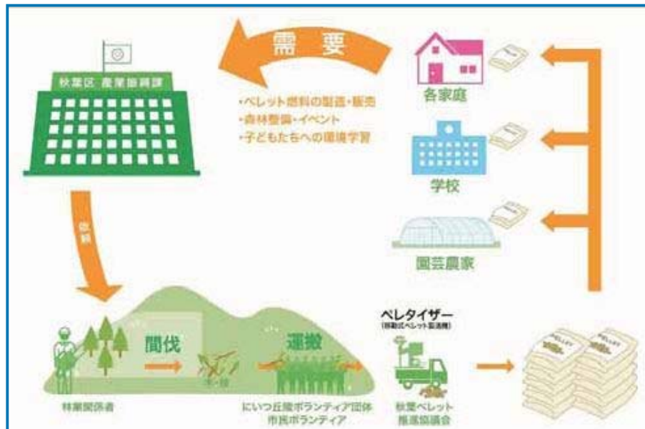
【ペレットの生産から消費の流れ】

そのために、間伐材を利用した木質ペレット燃料を園芸ハウスや学校、家庭などでの暖房利用の普及・活性化を図り、里山の保全整備をエネルギーの地域循環につなげていきます。あわせて、二酸化炭素の排出削減を図ります。