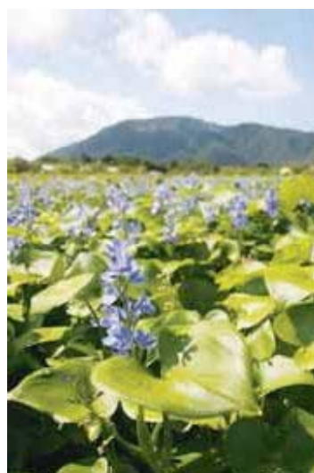
佐潟のミズアオイ群生地