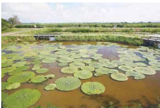
福島潟のオニバス 資料:ビュー福島潟

また、佐潟では、各主体と連携して新たにビオトープを整備し、有識者の協力も得ながら希少種の移植・展示などを図ります。ビオトープでの希少種の観察やモニタリングなどの生息・生育状況調査は、地域の児童や市民などと協働で実施するとともに、維持管理は地域コミュニティを中心に行い地域に愛されるビオトープづくりを進めます。