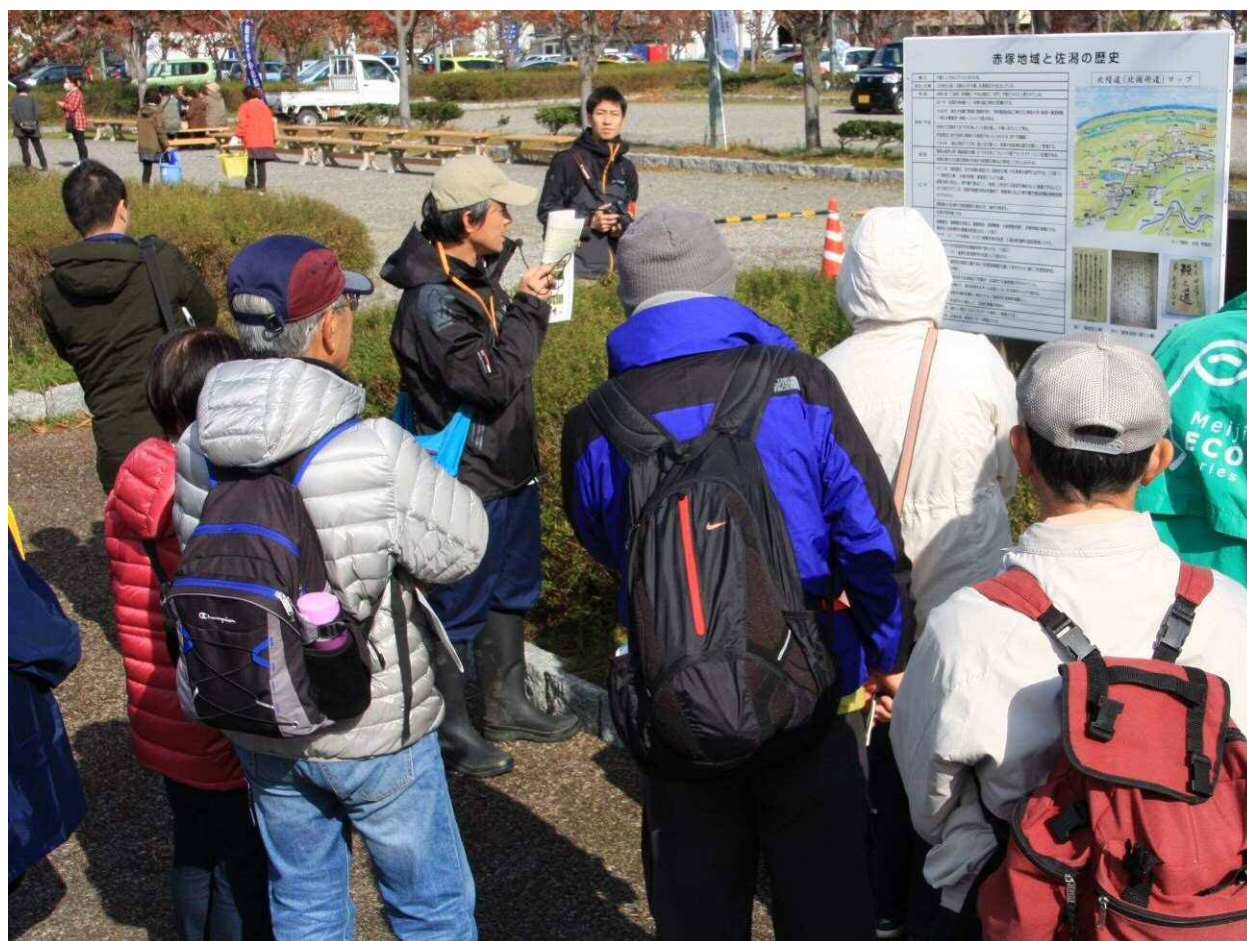
佐潟 20 ラムサールフェス開催の様子