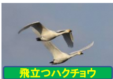
飛立つハクチョウ