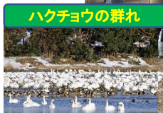
ハクチョウの群れ