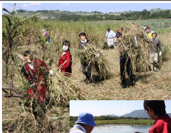
(上)刈り取ったヨシを束ねて運び出す。