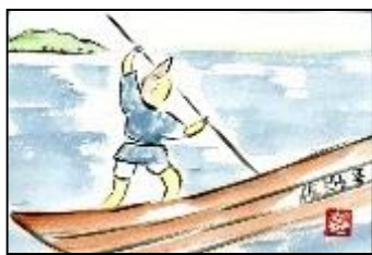
昨年度の応募作品(一例)

佐潟をテーマとした作品、はがき大でひとり3点まで。表現方法は自由(写真、絵、詩歌、立体作品など)。3月8日(日)まで受付・展示。賞の設定はありません。