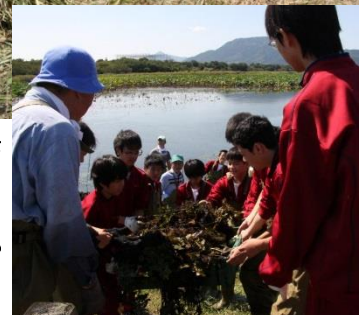
(右)水中に生えるヒシを陸上へ。泥だらけでの作業。