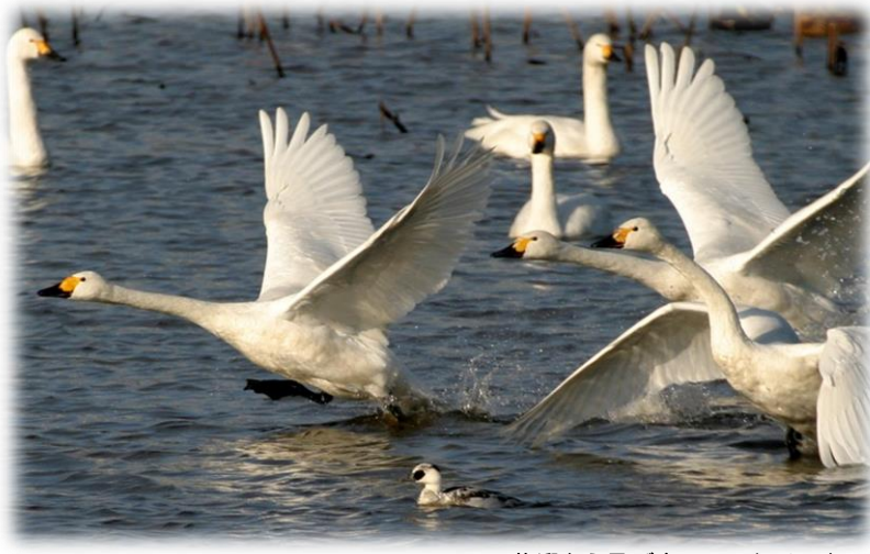
佐潟から飛び立つコハクチョウ

新潟市はコハクチョウの数が全国1位*1で最盛期には1万羽以上になります。佐潟がラムサール条約湿地として選ばれた基準もコハクチョウの数*2。市内には佐潟のほかにも福島潟や鳥屋野潟などの潟や、阿賀野川などの河川があり、ハクチョウをはじめとした多くの水鳥たちが羽根を休める大切な場所になっています。市内に広がる田んぼは彼らのレストラン。ハクチョウのいる田んぼは市民にとって身近で当たり前の風景です。