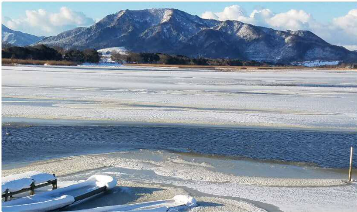
1月15日湖面が凍結状態