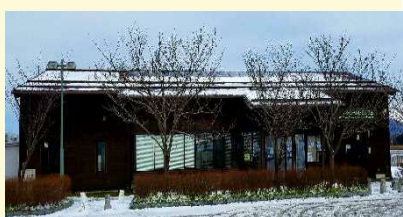
ラムサール条約湿地

【開館時間】 9:00～16:30 (冬期間11月から2月の土・日は7:00から) 【休館日】 月曜日 (祝休日の場合は翌日)、年末年始 (12月29日～1月3日)