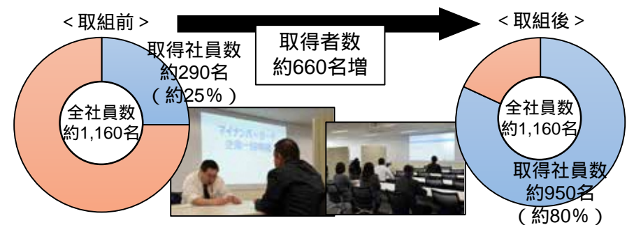
C社のマイナンバーカード取得状況