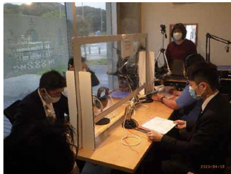
<FMラジオ番組「明日への扉」>