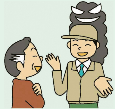
消費者庁イラスト集より

「不用品は何でも買い取る」と電話があったので、買い取ってほしいものを用意して家に来てもらったが、さっと見ただけで「貴金属はないか」と聞いてきた。「ない」と答えると、「絶対はないのか、うそを言うんじゃない」と凄んできたので怖くなり、普段はしまっている指輪を売却してしまった。しかし、後悔し、返してもらうために連絡するが「クーリング・オフはできない」と断られたなどの相談が寄せられています。特に高齢者が狙われるので注意が必要です。