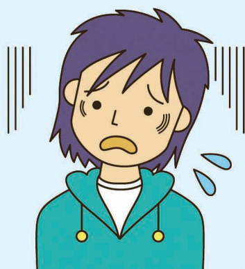
消費者庁イラスト集より

これから4月にかけて、進学や就職、転勤などで、新生活をスタートされる方が多くなります。特に、新規に賃貸住宅を契約される方、通勤・通学に車を使うために中古車を購入される方はご注意ください。毎年、多くの相談が消費生活センターに寄せられています。