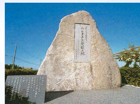
「ルレクチエ発祥の地」顕彰碑 (地図P3 C-5)