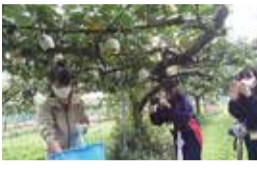
梨狩りの写真を撮っておもてなし