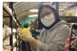
きのこの収穫体験中