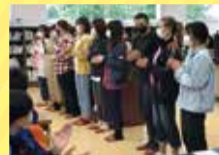
ありがとうございました!!

旅行会社でのノウハウを高校生に伝え、実行してもらうのはとても難しかったです。協力いただいた全てのスタッフに感謝します。