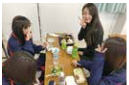
外国人とランチタイム