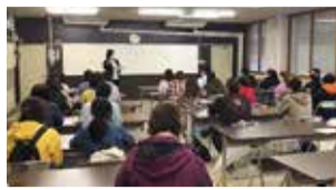
大勢の外国人のお客さんが参加してくれました

ツアーを進行する高校生はもちろんのこと、サポートする先生や農家さん、経営大学のボランティアスタッフ...みんながこの日のために万全の準備をしました。