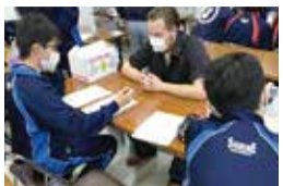
ツアーの感想をヒアリング!お客さんの生の声を聞きました

農業体験ツアーが終わり、ホッと一息。ツアー終了後は、外国人と交流したり、ツアーの感想を聞いたりしました。外国人の皆さんは、おもてなしのために生徒が作成した紙芝居や、ツアーで作ったわらぼうき、収穫した果物など、お土産の多さに驚いていました!