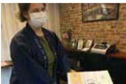
果物のパッケージデザイン作り