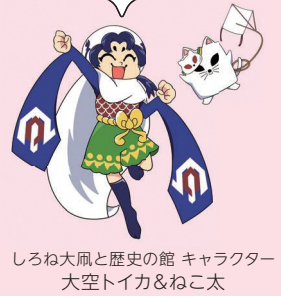
しろね大凧と歴史の館 キャラクター 大空トイカ&ねこ太