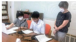
アナウンス録音の様子

地域や団体のイベント運営補助などのボランティア活動に取り組んでいます。一例として、多発する特殊詐欺被害を防止するため、被害防止啓発CDを作成し、スーパーなどに配布しました。