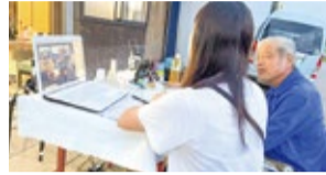
ゲストを招いてオンライン交流会中♪

参加者にどんな情報を知りたいかアンケートを取るなど、双方向でやり取りができるのがコミュニティの魅力です! 南区には魅力的な人が大勢います。そんな人たちをゲストに招き、オンライン交流会も行っています。