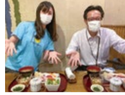
市内在住の参加者が南区に来てくれました

「南区にはこんな素敵な所がある!」と参加者が発見し、その魅力を友人に話し「南区好きの輪」を広げていくコミュニティを目指しています。そのために現在、いろいろなイベントを計画中です。