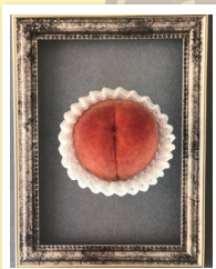
「しろねの美しい桃」 m.k.j16さん