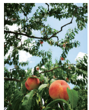
「茨曾根の桃畑で」 gata.gata40さん