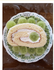
「自分でアレンジ」 muheizhenmeiさん