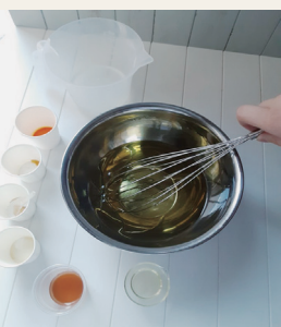
ルレクチエのせっけん作成の様子

果樹のハネもの(形や大きさなどが規格外のもの)を活用し、ルレクチエなどのせっけんの開発・販売を農家・学生・事業者が連携して行います。食品以外に加工することにより、ハネものの活用の幅を広げます。