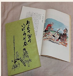
冊子「あつたてんがのいばらそね」

地域の昔語りを集めた冊子「あつたてんがのいばらそね」から舞台劇用の台本を作成し、専門家指導の下で地域の子どもが大人と共に練習し、地域のイベントなどで発表します。