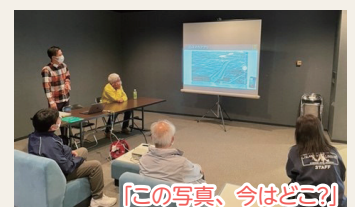
「この写真、今はどこ?」

○しろね大風と歴史の館を会場に事業を行いました。 ○「白根大風合戦と商店街の今昔」では白根商店街の昔の写真のパネルや、白根大風合戦の歴代ポスターを展示しました。 ○「この写真、今はどこ?」はクイズ形式で、昔の写真を映写し、参加者が現在の場所を考えました。 ○映画「白根紙鷲見聞録風ノ国」の上映会には、大勢の人が観覧に訪れました。