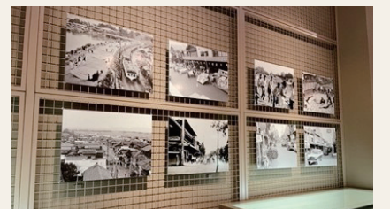
昨年度の写真展示の様子

白根大風合戦と商店街の今と昔の写真の展示、ドキュメンタリー映画「風ノ国」の上映、白根の古い写真を用いたクイズ企画を実施します。