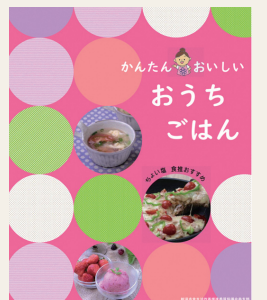
地産地消レシピ集

①地産地消レシピを活用して白根高校生が調理体験を実施します。 ②“心と身体の健全な発育”を体現する川合俊一氏(日本バレーボール協会会長)をお招きして、トークセッションを開催します。