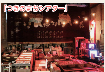
「つきのまちシアター」

○月潟農村環境改善センターに展示している角兵衛獅子などの資料や、かつての映画館「月潟劇場」を調査し、ホームページに結果を公開しました。 ○月潟地区全体を舞台に、イベント「つきのまちシアター」を開催。「月潟劇場」にあった日用品、資料、映像を交えてアート展示をし「月潟稽古場」では映画を上映するなど、魅力的な空間を生み出しました。