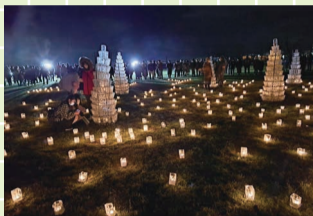
茨曾根イルミネーション

○1年生が探究の時間で準備をした「茨曾根どんど焼き」でのイルミネーション企画では、地域の皆さんの協力により、会場を華やかに飾ることができました。ペットボトルツリーの光とアイスキャンドルの炎の演出は、来場した皆さんに笑顔を届けることができ、大成功でした!