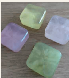
色とりどりのフルーツせっけん

また、廃棄されることもあるハネものを有効に活用することで、SDGsにも貢献しています。