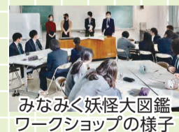
みなみ妖怪大図鑑ワークショップの様子