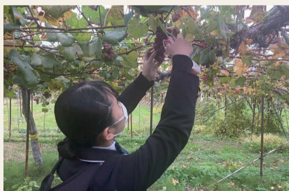
収穫体験をする日本文理高校の学生