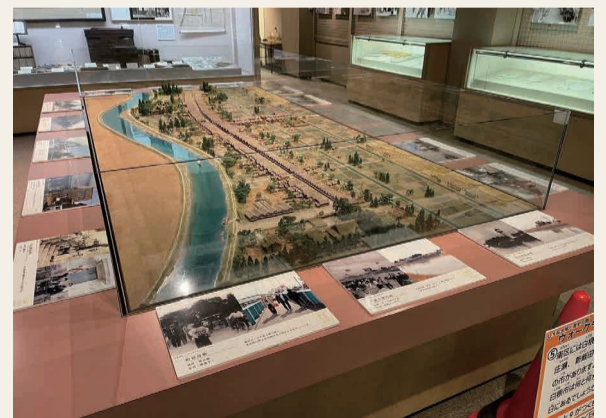
歴史展示コーナーに展示されたパネル

実施日 令和4年10月29日～11月13日 会場 しろね大嵐と歴史の館 参加人数 1,577人(映画の観覧者は35人)