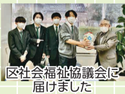
区社会福祉協議会に届けました