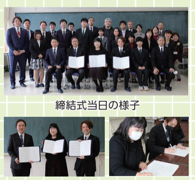
締結式当日の様子

新学期も始まり、新1年生58人が入学しました。地域に根付いた白高生として、充実した高校生活を送ってほしいです。 令和4年3月の南区に加え、先月末には「にいがた南区創生会議」とも連携・協力に関する協定を締結しました。「にいがた南区創生会議」は、南区のさまざまな分野で活躍する若手が集まり、南区の明るい未来の実現のために活動しています。協定締結により、昨年度以上に活躍の場が広がり、生徒が多くの刺激と学びを受けながら成長することを期待します。また、創生会議の皆さんの目線で白根高校の魅力化にも取り組んでもらえるということで、こちらにも大きな期待をします。今年度もこのコーナーで白高生の活動を紹介します。引き続き地域の人たちとのすてきな出会いと、たくさんの活動に注目してください。