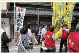
一日人権擁護委員活動

6月は全校ボランティアの活動が盛んになります。白根大風合戦会場では、一日人権擁護委員活動やシャトルバス発着所での観光案内、降車人数チェックと、大活躍でした。新しい試みとして「白根のまち歩き×スマホ講座」に運営補助として参加しました。今年度も生徒たちは地域から多くのことを学ばせてもらいます。