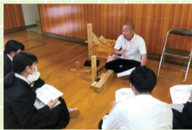
2年生探究の時間「ゲストトーク」

「総合的な探究の時間」の学習がスタートしました。1年生はまず「探究とは？」を考えるとところから出発です。自分で考え、考えたことを人に伝え、共有し合うことで自分なりの「正解」を見つけていくことだと学びました。2年生は「将来の自分」を考えるため、いろいろな種類のゲストを招き、仕事に対する思いややりがいなど、貴重な話を聴きました。自身の将来について考える、実りある学習でした。これらの学習の様子は学校ホームページ(上部二次元コードから)に順次掲載しますので、ぜひ見てください!