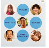
令和4年度 「仕事人の図鑑Vol.2」