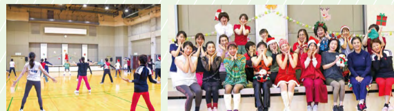
クリスマスパーティーで楽しみました!

指導者の声 教室を始めたばかりのころは「ZUMBA(ズンバ)って何?」という反応でしたが、今は20人超えの教室になりました。心を開放して、楽しくやってもらいたいです。もちろん教える立場の私も一緒に楽しんでいます!