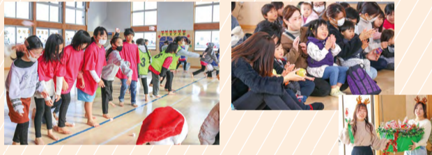
小学生はゲーム、小さいお友だちはコンサートを楽しみました♪

区内の児童館・児童センターは4館(白根児童センター・味方児童館・白根北児童館・白根南児童館)あります。どこも趣向を凝らした、子どもたちが喜ぶイベントが盛りだくさんです。