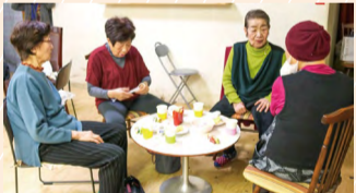
ここに来ると誰かに会えて、おしゃべりができるね♪

地域の茶の間は「どなたでもどうぞお入りください」という場です。皆さんの住んでいる地域でも開催しています。白根商店街で開催している「きらきら」におじゃますると、お茶を飲みながら、皆さんの楽しそうなおしゃべりと笑い声が会場に広がっていました。