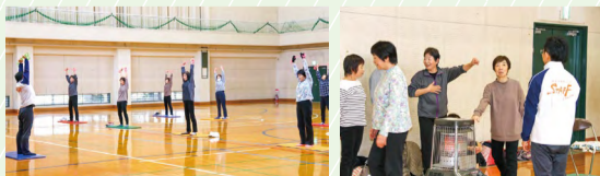
頭と体を使っていきいき健康!

参加者の声 教室に参加してから皆さんと仲良くなりました。手・足それぞれ別の動きをすることで、頭の体操もできます。難しいんですよ!でも、間違うとみんなで笑い合ったりしてとても楽しいです。