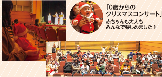
「0歳からのクリスマスコンサート」赤ちゃんも大人もみんなで楽しみました♪

子育て中のみなさんを応援する子育て支援リーダー「子育てオーエンジャー☆みなみ」は区内各地で「子育て広場」を開催しています。