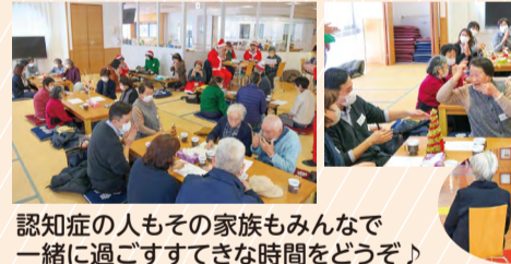
認知症の人とその家族もみんなで一緒に過ごすすてきな時間をどうぞ♪

認知症カフェは「認知症の人やその家族、地域の人たちなど、誰でも気軽に参加できる集いの場」です。介護職員が必ずいますので、何でも相談してください。おしゃべりやハーモニカ演奏、認知症予防体操など月に1回、みなさんで楽しい時間を過ごしましょう。