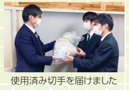
使用済み切手を届けました

来年度も地域の役に立ち、生徒自身も成長できるよう、さらなる活動の場を広げていきたいと思っています。