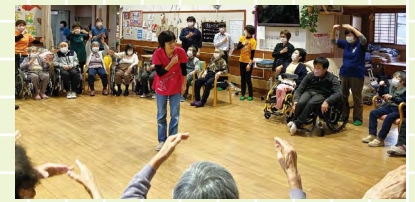
ミュージックケアの様子