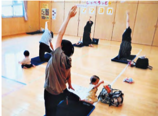
「しゃべろっと」ママヨガの様子

私は味方児童館での「しゃべろっと」や月湯地区公民館での「きらきらフレンド」を担当し、絵本の読み聞かせや親子ふれあいヨガ、助産師によるベビーマッサージ、人形劇など親子で楽しめるイベントを企画しています。