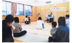
「しゃべろっと」ほっこりコンサートの様子

活動しているスタッフは、子育て中のママや子育てが終わり一息ついた人、孫育て中のおばあちゃん、毎年大人気のおも掘りイベントで使う畑の世話をしているおじいちゃんなどさまざまですが、スタッフみんなで子育てしている人を全力で応援しています。