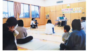
「しゃべろっと」ほっこりコンサートの様子

活動しているスタッフは、子育て中のママや子育てが終わり一息ついた人、孫育て中のおばあちゃん、毎年大人気のおも掘りイベントで使う畑の世話をしているおじいちゃんなどさまざまですが、スタッフみんなで子育てしている人を全力で応援しています。