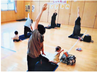
「しゃべろっと」ママヨガの様子

私は味方児童館での「しゃべろっと」や月湯地区公民館での「きらきらフレンド」を担当し、絵本の読み聞かせや親子ふれあいヨガ、助産師によるベビーマッサージ、人形劇など親子で楽しめるイベントを企画しています。