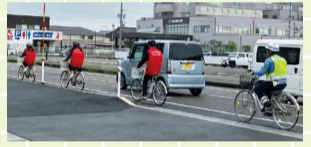
ヘルメットを着用して走行!

5月20日には、南警察署交通課の「ヘルメットするめっと」の活動にヤングボランティアとして参加しました。新潟市は「ヘルメット着用率が低い地域」との調査結果があり、そこで南警察署が「南区にヘルメットのある景色を増やそう」とこの活動を企画。学校から原信白根店までヘルメットを着用して走行し、隣接する無印良品の店舗前でも広報活動をしました。自分たちが着用時の絶対的な安心感を体験したことで、積極的にヘルメット着用の呼び掛けをすることができました。