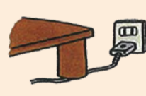
③ コードの上に重いものを置かない