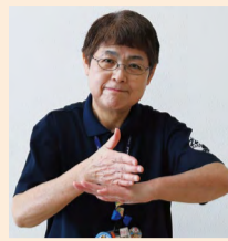
片方の手の平を下に、反対の手を縦にして甲の上に乗せる