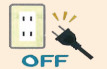
④ 使わない時はコンセントを抜く