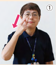
① 人差し指で頬をなで下ろす