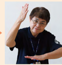
手の甲に乗せた縦の手を顔の前まで上げる