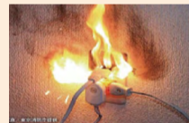
① プラグにほこりを溜めない

令和5年中では8月の火災件数が最多となり、建物火災の出火原因として電気機器からの出火が最も多くなりました。次の4つの点に注意し、電気機器による火災をなくしましょう。