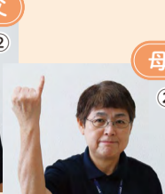
② 小指を立て高く上げる