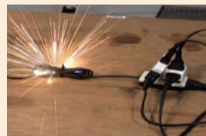
② コードを束ねない