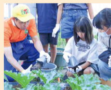
園長に野菜の植え方を教えてもらいました!

6/19 今回は谷口園長(谷口海斗選手)が白根北児童館に来館し、子どもたちと一緒に野菜の苗を植えました。