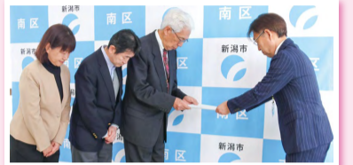
長浜区長に建議書を渡す会長と副会長

第10期では、新しい体制の中で「地域と行政の協働の要」として、南区がより良い地域になるよう、活発に活動されていくことを期待します。