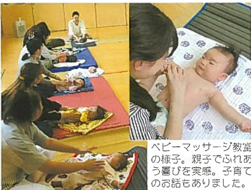
ベビーマッサージ教室の様子。親子でふれあう喜びを実感。子育てのお話もありました。

公民館では、年一回この時期に開催していますが、ご希望があれば二回目も検討したいと考えています。