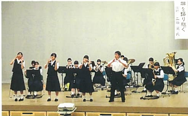
味方中学校吹奏楽部の皆さん