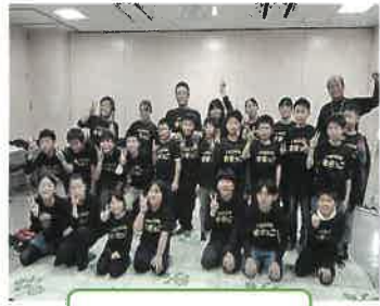
白根学習館まつり