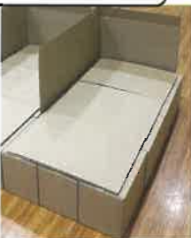
段ボールベッド組立