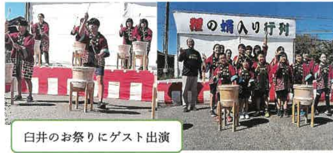
白井のお祭りにゲスト出演