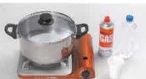
災害時ご飯の炊き方の実演