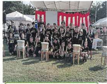
サマーフェスティバル 2024

スタート致しました。毎月第2・第4月曜日 午後7時〜8時、茨曾根小学校校体育館で実施