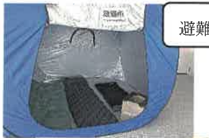
災害用備蓄品展示品