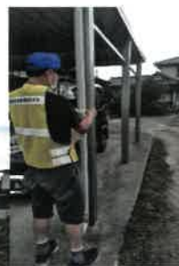
が印 ブ目 一認 テ確 色否 黄安

訓練内容「安否確認の取り方」 下茨自治会では、年2回の防災訓練を行う事に決め、今回は、地域住民の安否情報の集約訓練を致しました。