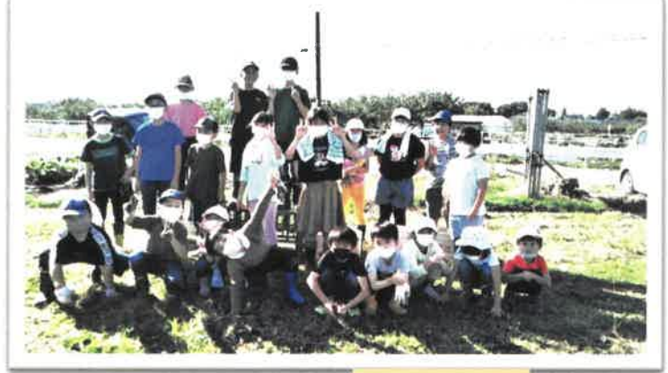
つるが伸び放題、子供達は大きなさつま芋をたくさん収穫できました。