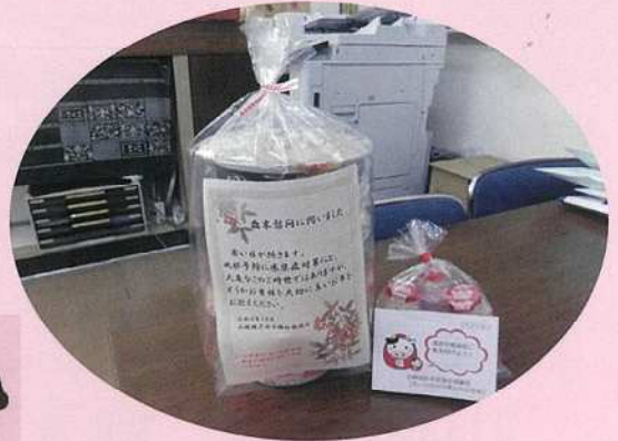
あったかい贈りもの