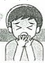
（日本小児アレルギー学会の冊子による）