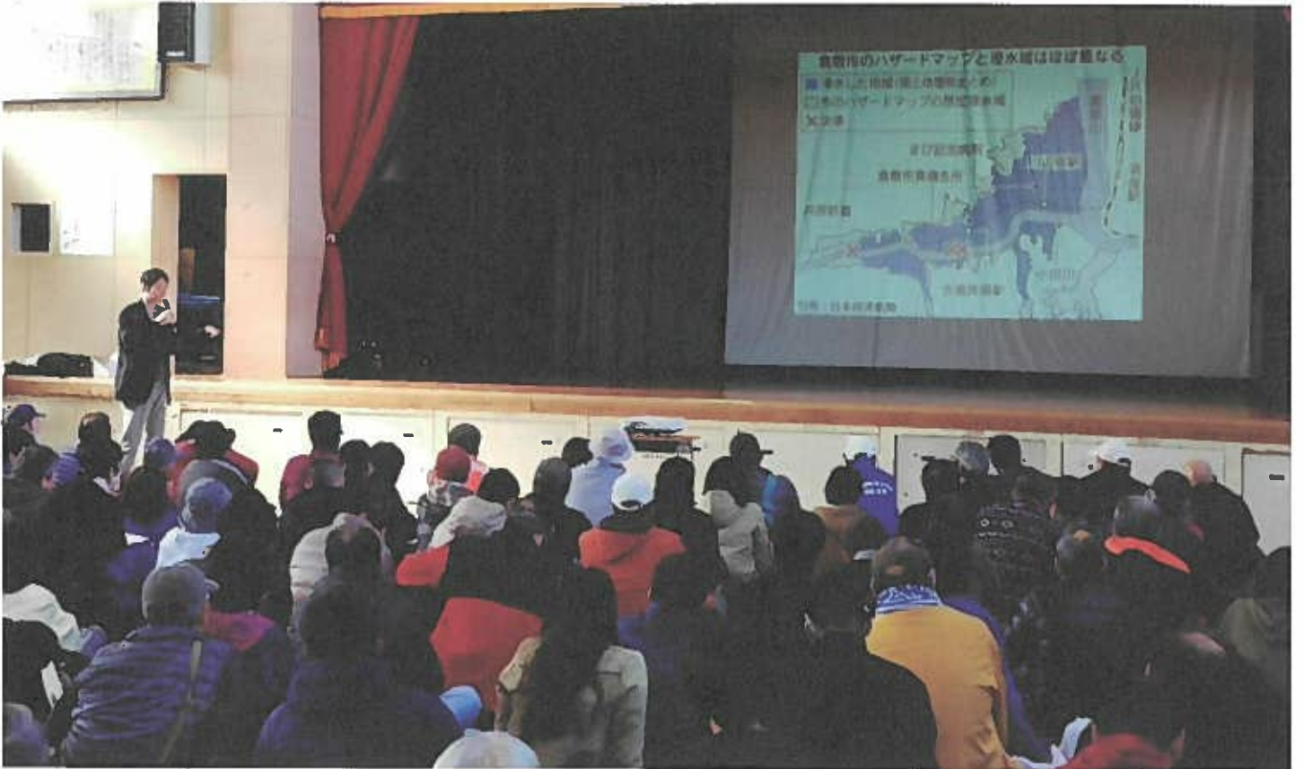
※講話・講習の様子