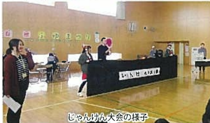
じゃんけん大会の様子