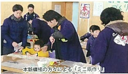
本新蝶組の方々による「ミニ凧作り」

2月25日(日)、白根児童センターで開催しました。カトリック幼稚園児21名による組体操発表でオープニングがスタートしました。アリーナでは昔遊び体験コーナーをはじめ、エコバッグ作りやミニ凧作り、迷路、射的、ストラックアウト、お楽しみ魚釣りなどの遊びと工作のブース。