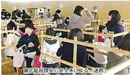
南区総務課安心安全係による「迷路」