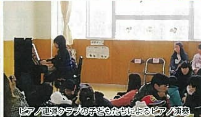
ピアノ連弾クラブの子どもたちによるピアノ演奏

集会室では作品展示、くじ引き。工作室では綿あめ、ポップコーン、パンやクッキー、福祉バザーやこんにゃく煮の販売。遊戯室ではケーキ販売とフリードリリンクコーナー。1階ではフードバンク、シアター上映を行いました。地域の多くのボランティアの皆さんのおかげもあり、各コーナーでは混乱もなく楽しんでもらえた様子でした。白根の文化「ミニ凧工作」の