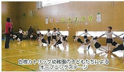
白根カトリック幼稚園の子どもたちによるオープニングステージ