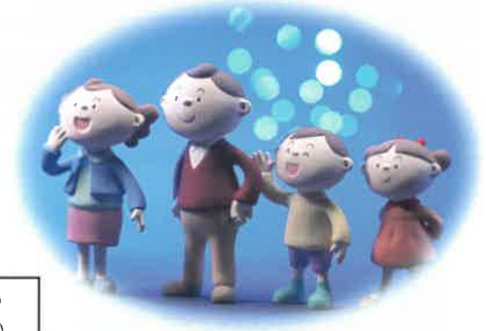
令和4年度 臼井地区 自主防災会委員