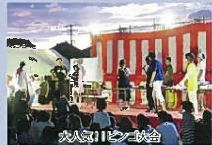
大人気!!ビンゴ大会