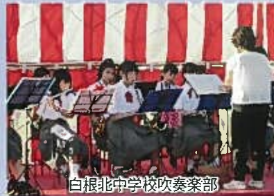
白根北中学校吹奏楽部