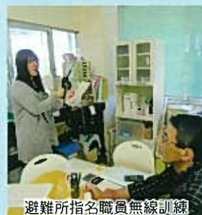
避難所指名職員無線訓練