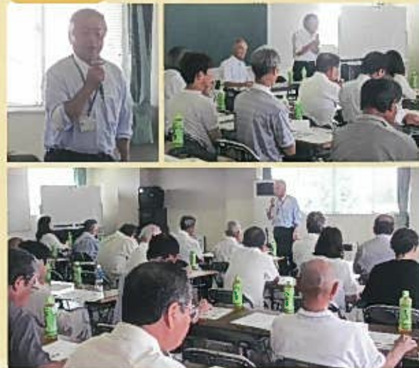
人口減対策(地域カルテ)について意見交換をしました。