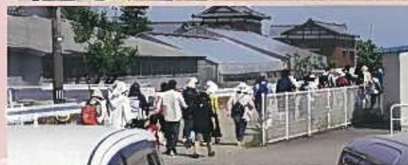
体重をはかって体を管理するきっかけづくり