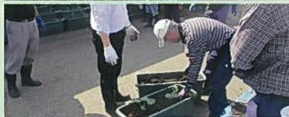
琉球すずめうりと坊ちゃんかぼちゃで緑のカーテン。