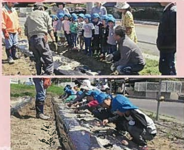
じゃがいもの種イモに興味津々でした。