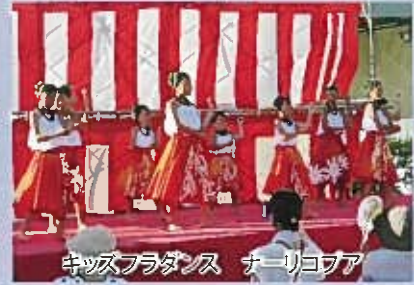
キッズフラダンス ナーリコア