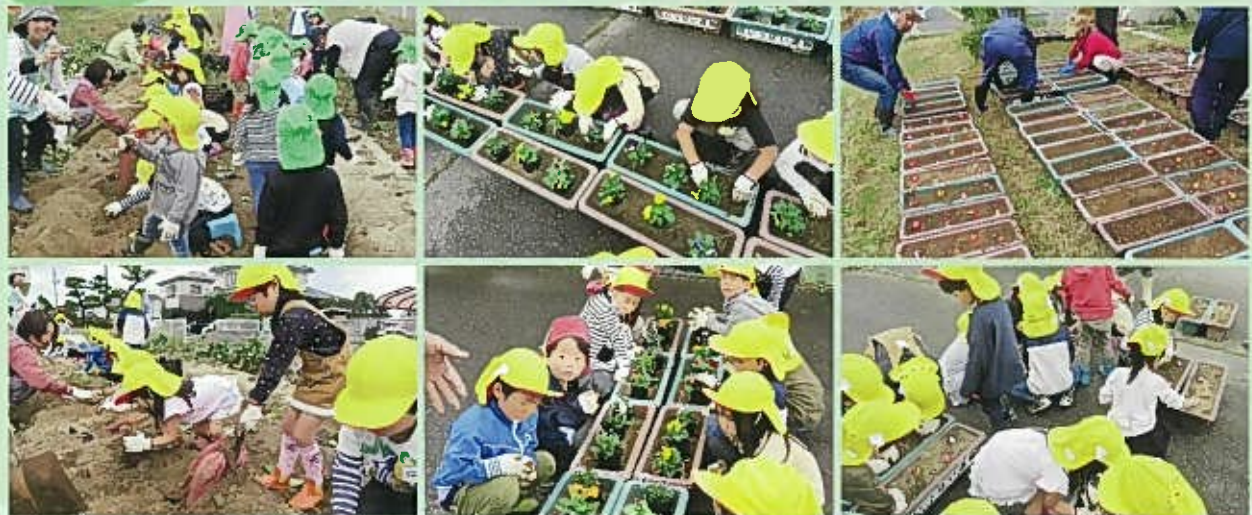
さつまいもを収穫して、パンジー・ピオラ、チューリップの球根を植えて、たくさん土と触れあった1日でした。