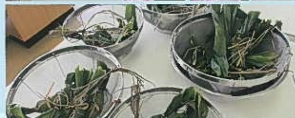
笹団子の縛り方も上手にできました。