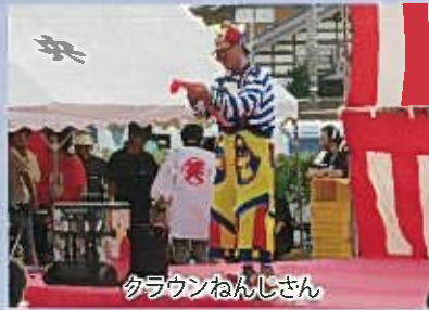
クラウンねんじさん