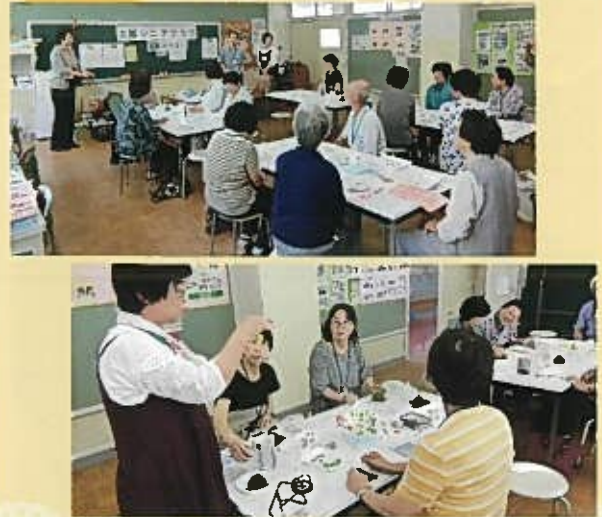
粘土でかわいい苔玉風の盆栽を作りました。