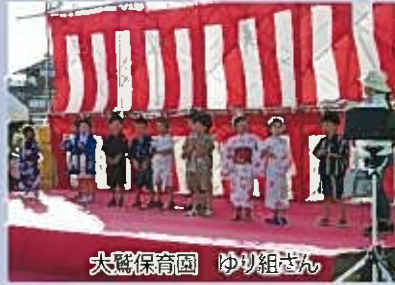
大鷲保育園 ゆり組さん