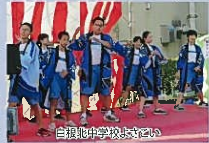
白根北中学校まさこい