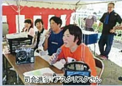
司会進行:アスタリスクさん