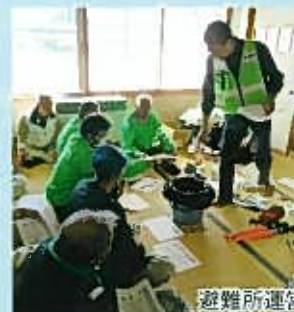
避難所運営セットの確認