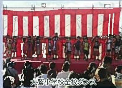
大鷲小学校全校ダンス