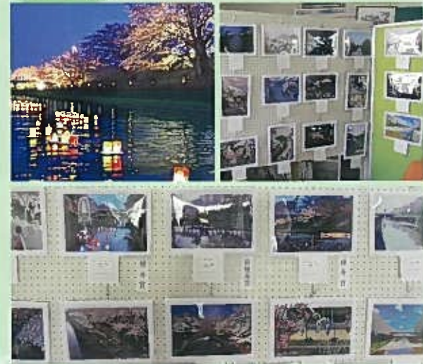
桜の風景もそれぞれの趣があります。