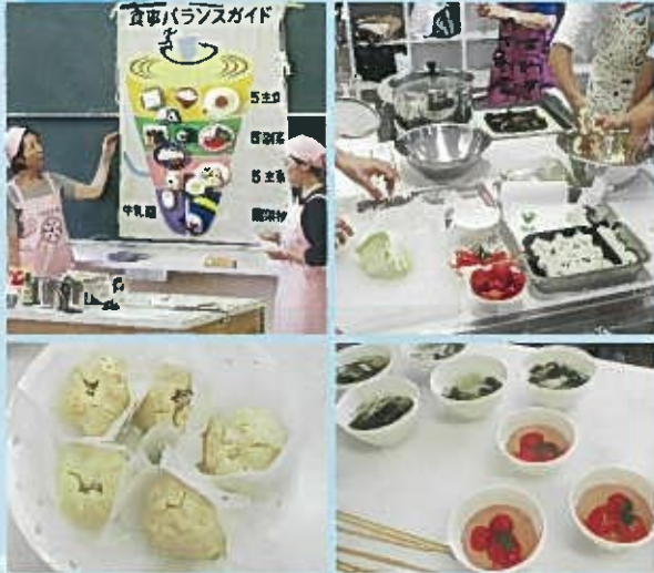
朝ごはんの重要性を知って、手軽に朝ごはん作り。