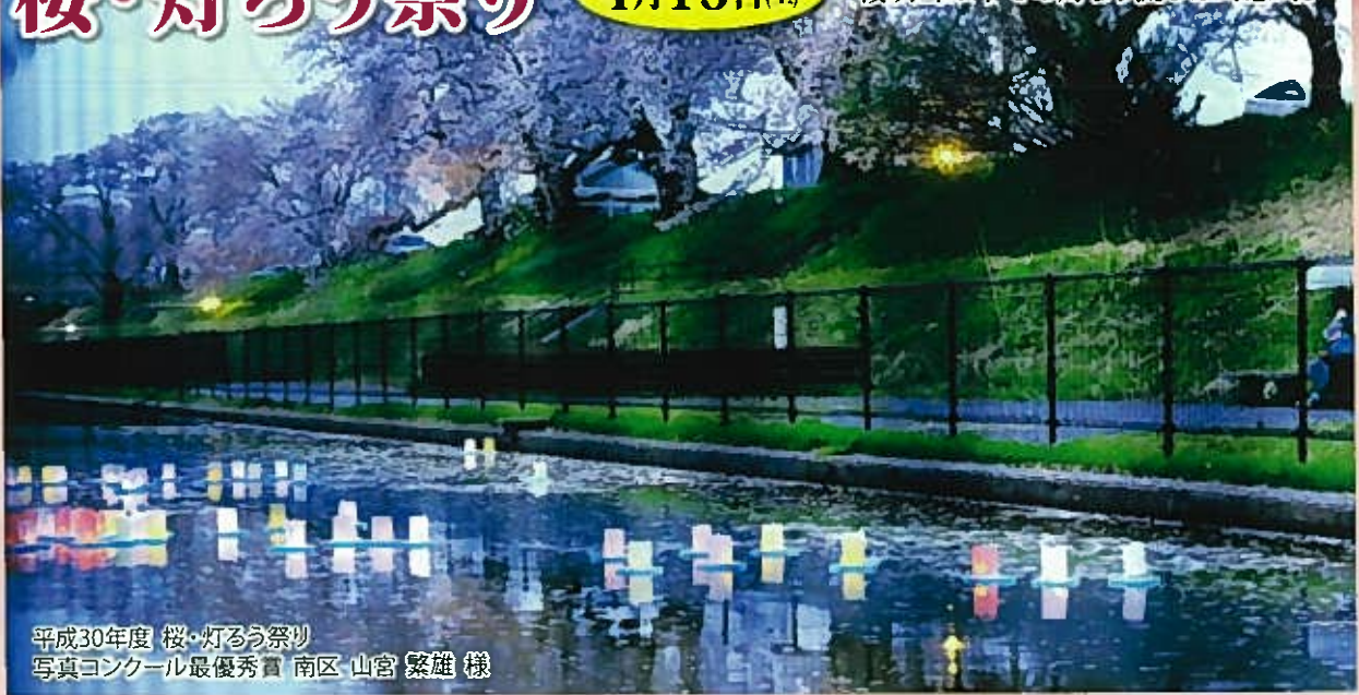
平成30年度 桜・灯ろう祭り 写真コンクール最優秀賞 南区 山宮 繁雄 様