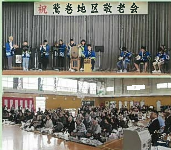
アトラクションを楽しんで元気な笑顔がいっぱいです。