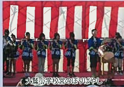
大鷲小学校宮のぼりばやし