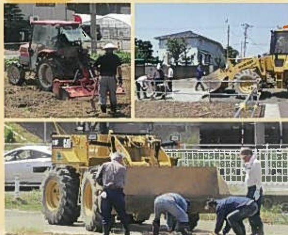
大きなひまわりが咲くように土の手入れを入念に。