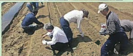
ひまわりの種を一粒づつ丁寧に植えました。