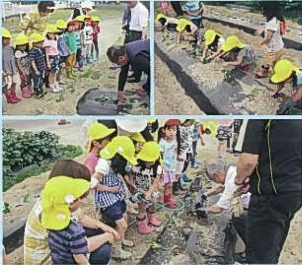
さつまいもの苗うえから水やりまで丁寧に作業しました。