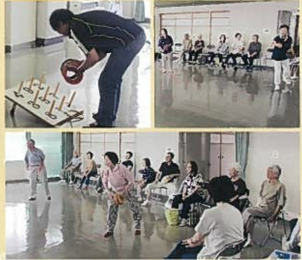
的を狙う手元のスナップは絶妙です。