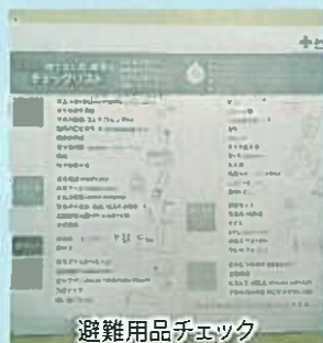
避難用品チェック