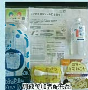
dable ter B 訓練参加者配布品