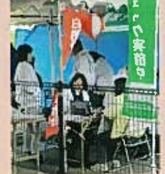
手作り灯ろう作成