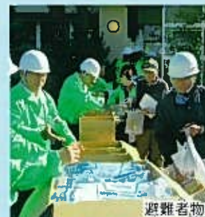
避難者物資の配布訓練