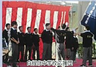
白根北中学校応援団