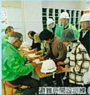
避難所開設訓練(避難者カード記入)

鷺巻地区自主防災訓練は南区総合防災訓練に合わせ、地震を想定した区全体での情報伝達、鷺巻地域生活センターの避難所開設、避難行動要支援者(要援護者)対応を中心に実施し、DVD鑑賞では「地震だ! その時どうする? ~自分を守り、みんなで助け合おう~」で自助、共助の大切さを学びました。