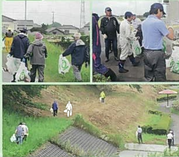
小雨の中、朝早くからの清掃活動お疲れ様でした。