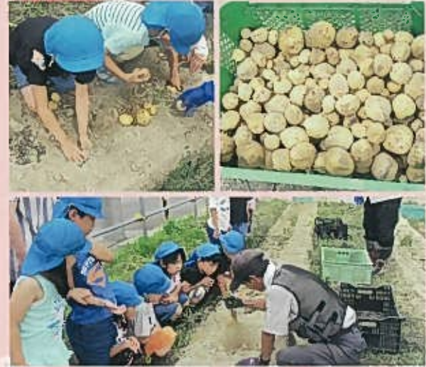
ゴロゴロと大きなじゃがいもで今年も豊作でした。