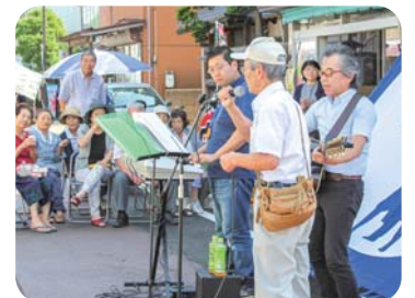
本格オープンイベント

月潟の「市」開催日 毎月2と7のつく日(場所:月潟商店街) 「お休み処獅子の里」のオープン時間 8時半～11時 問い合わせ 月潟コミュニティ協議会 ☎372-6905