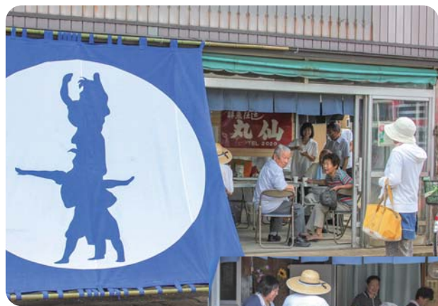
「お休み処獅子の里」

今後は、定期的にイベントを開催し、PRしながら、交流の場づくりを進めまちなにぎわいを取り戻すために「市」の活性化に向けて取り組んでいきます。