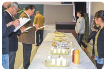
スイーツコンテストの様子

昨年度は地元農産物を利用したスイーツコンテストを開催し、小・中学生を含む18作品の応募がありました。地元商工関係者や有識者による審査会が開かれ、グランプリ作品、優秀作品が選ばれました。その中から今年度、改良を重ね、一つの商品として提供ができる物が出来あがり、にいた祭りにて地域住民の皆さんに試食していただくことができました。