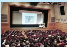
「家族ふれ愛月間」講演会