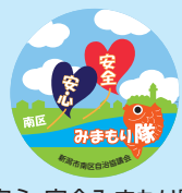
安心・安全みまもり隊ステッカー