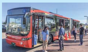
連節バス「ツインくる」

南区公共交通PR事業として区バスの利用啓発活動や防犯・防災啓発事業として「安心・安全みまもり隊」ステッカー作成など行いました。