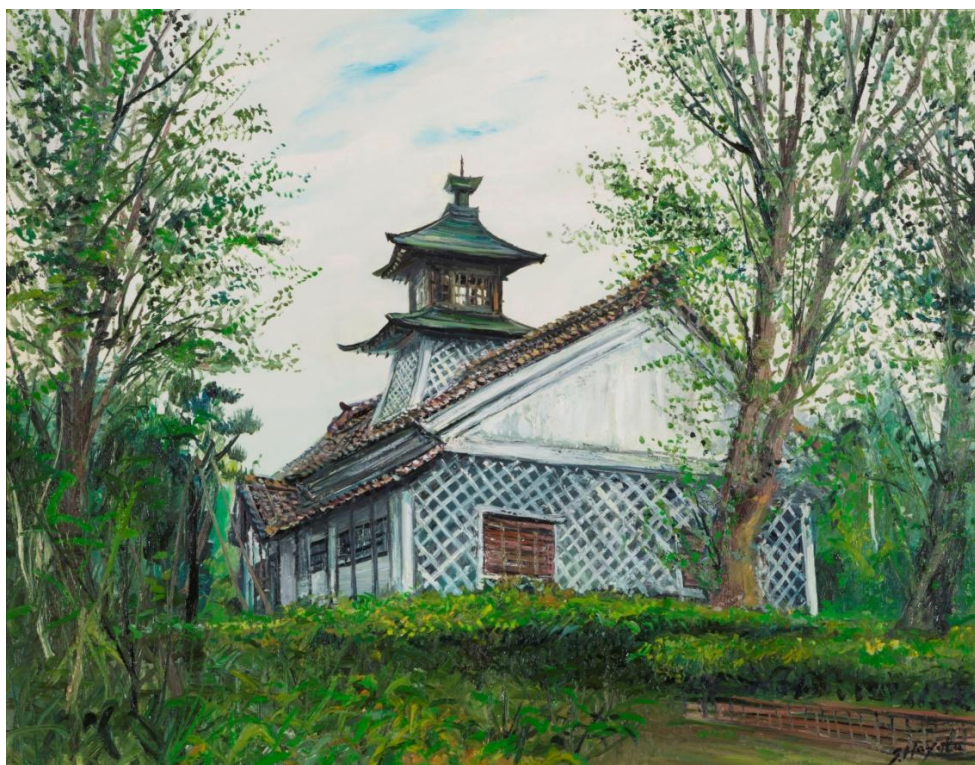
早津 剛 《旧新潟税関》 1991年 新潟市新津美術館蔵