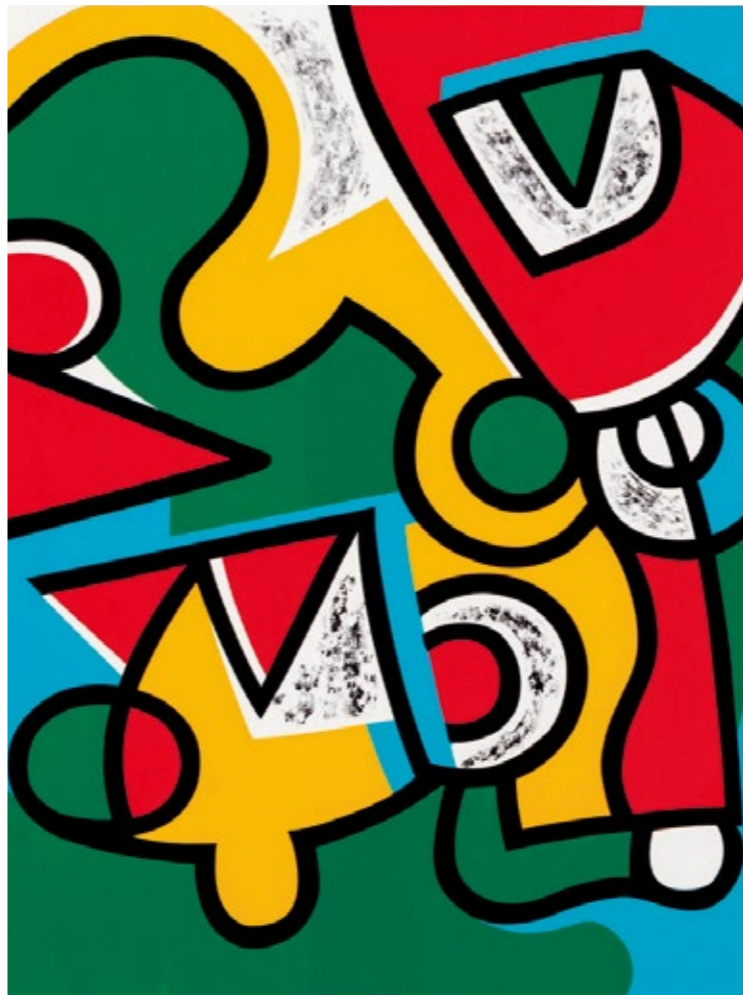
張替正次 <回転> 1978年 当館蔵 コレクション展Ⅲ 版画のかたち いろいろ(9月14日[土]～12月22日[日])に出品予定