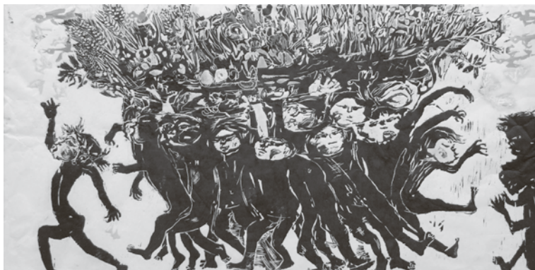
4 式場庶謳子《子どもたちの春の使い》1978年 新潟市新津美術館蔵