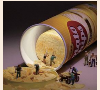
掘っても掘っても止まらない食欲 (2017年)