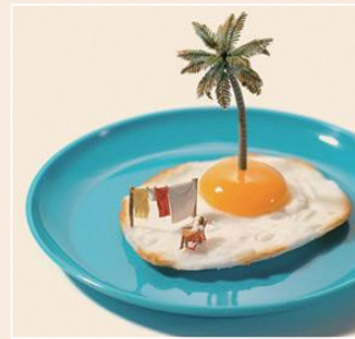
マミーサイドアップ (2016年)

1981年熊本生まれ。2011年、ミニチュアの視点で日常にある物を別の物に見立てたアート「MINIATURE CALENDAR」を開始。以後毎日作品をインターネット上で発表し続けている。主な仕事に、2017年NHKの連続テレビ小説「ひよっこ」のタイトルバック、2020年ドバイ国際博覧会 日本館展示クリエイターとして参画、など。Instagramのフォロワーは330万人を超える(2021年10月現在)。著書に「MINIATURE LIFE」、「Small Wonders」、「MINIATURE TRIP IN JAPAN」、「MINIATURE LIFE at HOME」など。🌐 https://miniature-calendar.com/