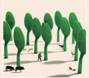
ハングリーハンター (2017年)

Instagramのフォロワーは330万人を超え、世代や文化を越えて世界中で人気を博しています。本展は、全国で150万人以上を動員した「MINIATURE LIFE展」の第2弾です。代表作を含む写真作品約120点と実物のミニチュア作品約50点を紹介し、田中達也のユニークな作品世界の魅力や制作の秘密に迫ります。