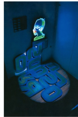
大竹伸朗《日本景／夏の海》1997年 ネオン管、ステンレス、ファウンドオブジェクト(ブリキ) 当館蔵

改修休館中の新潟市美術館所蔵品を活用し、新津美術館所蔵品と併せて展示。これまで展示機会の少なかった両館所蔵品を中心に紹介します。出品作家：大竹伸朗、金沢健一、草間彌生、ほか