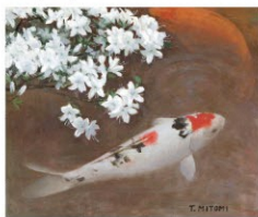
三富與一《五月の鯉》1968年