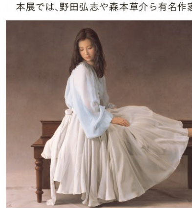
森本草介《未来》2011年 油彩

世界で初めての写実絵画専門の美術館として、2010年、千葉市にオープンしたホキ美術館。全国はもとより海外からも訪れるファンに、写実絵画の魅力伝えていきます。