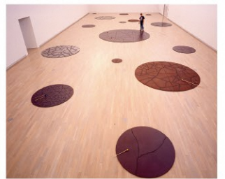
金沢健一展会場(新津美術館、2000年)

改修休館中の新潟市美術館所蔵品を活用し、新津美術館所蔵品と併せて展示。これまで展示機会の少なかった両館所蔵品を中心に紹介します。出品作家：大竹伸朗、金沢健一、草間彌生、ほか