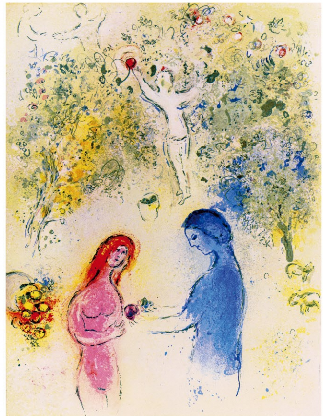
マルク・シャガール『ダフニスとクロエ』屏絵 1961年 リトグラフ © ADAGP, Paris & JASPAR, Tokyo, 2023, Chagall® X0184 シャガール展[7月20日(土)～9月29日(日)]に出品予定